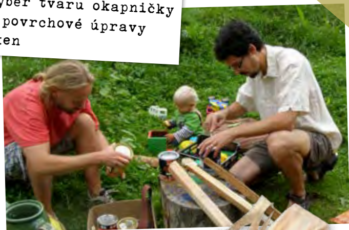
Výběr tvaru okapničky a povrchové úpravy oken

Každá klika má jiný tvar. Podle čeho jej volíš? Je každá originál?