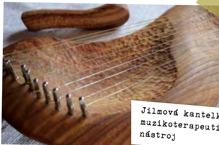
Jilmová kantelka - muzikoterapeutický nástroj